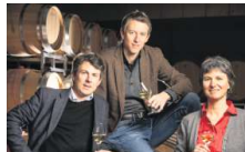
Domaines Rouvinez SA