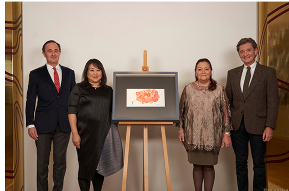
Besitzerfamilie Rothschild mit der Künstlerin Chiharu Shiota