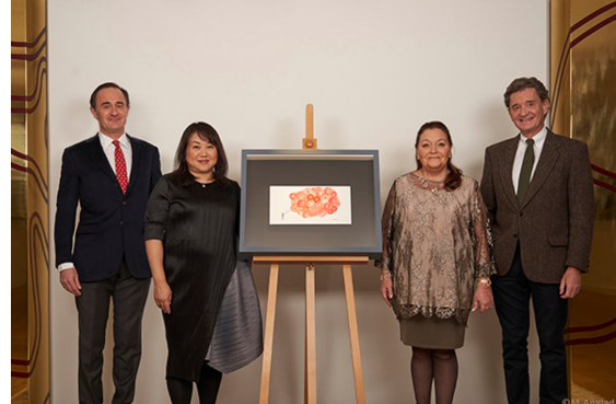
Besitzerfamilie Rothschild mit der Künstlerin Chiharu Shiota